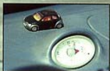
Der Ka läuft rund um die Uhr