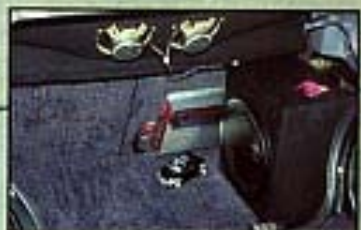
Ein bisschen Musik füllt den Kofferraum