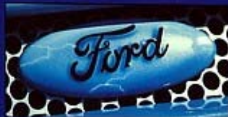
Die Pflaume wurde designmäßig integriert

Langsam aber sicher, quasi sehr zielstrebig, tasteten sich die beiden an das Tunen heran. Bescheiden und alltagstauglich wurde das Fahrwerk. Hier wählten sie Tieferlegungsfedern von Weitec, 35/20 Millimeter (w/h) ist der Wagen dem Asphalt näher gekommen. Die CMS-Alufelgen stammen von Jörns