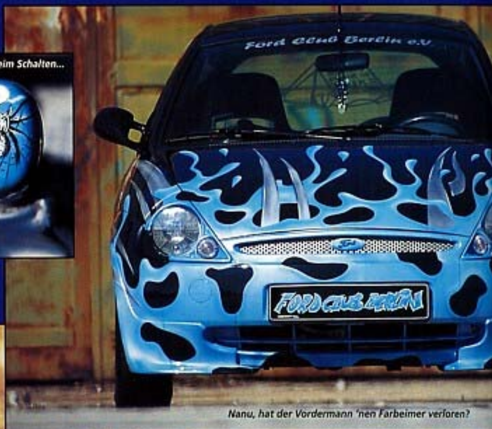
Nanu, hat der Vordermann 'nen Farbeimer verloren?