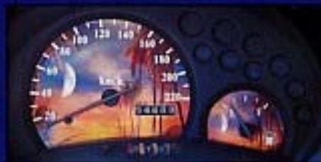
Zeit für Urlaub!

Susis 18. Geburtstag und die Führerscheinprüfung standen bevor, da machte sich ihr Freund Jörn auf die Suche nach einem Wagen - natürlich einem Ford. Er telefonierte einige Händler ab und bekam prompt ein verlockendes Angebot. Ein Ka - von dem Susi schon immer träumte - in der Pro7-Ausstattung