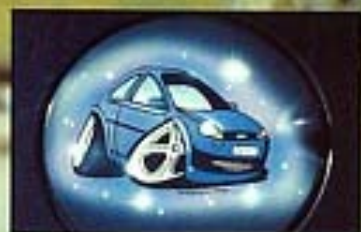
Der Kleine lebt auf großem Fuß