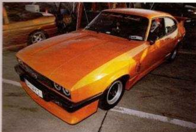
Youngtimer sind im Kommen!