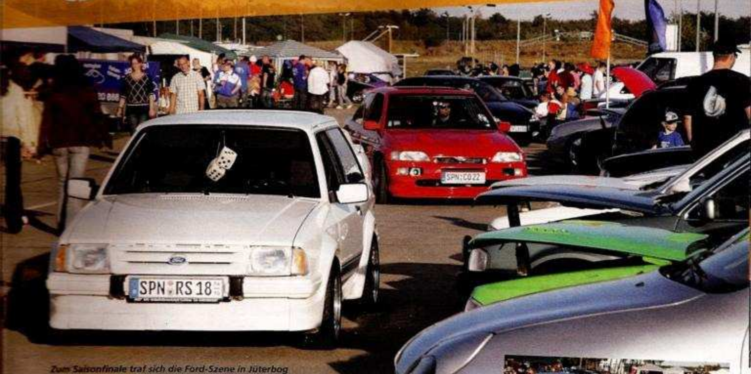
Zum Saisonfinale traf sich die Ford-Szene in Jüterbog