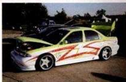
Wildes Design für die Limousine