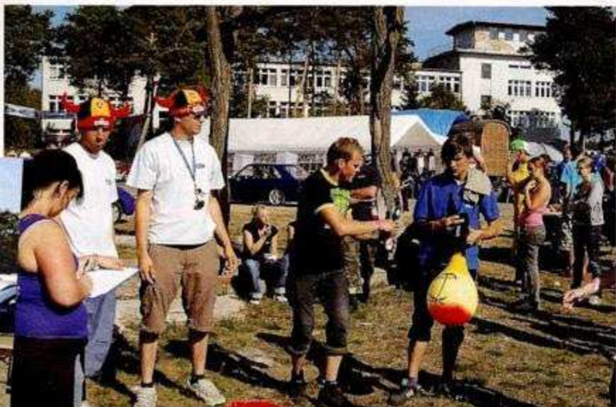
Clubspiele gehören traditionell zum Programm