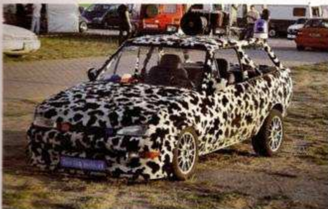
Warum nicht mal was anderes?