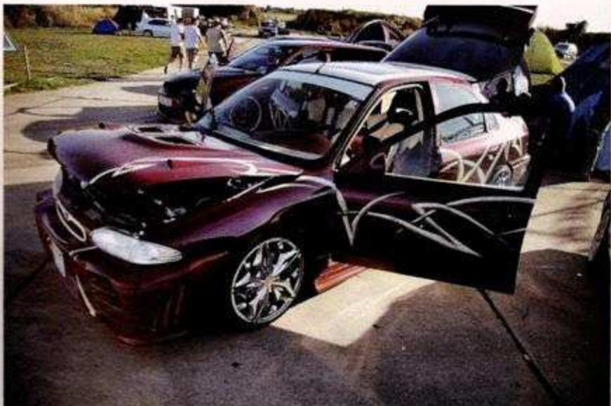
Individualität ist Trumpf!