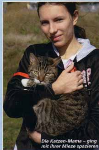
Die Katzen-Mama – ging mit ihrer Miezze spazieren