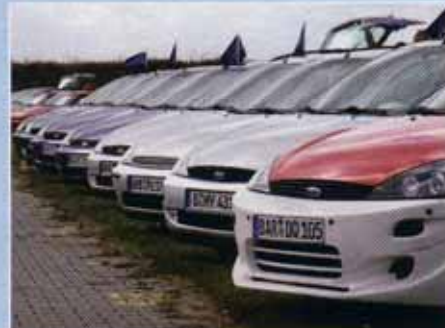
Der Ford Focus Club Deutschland

Erbsen weiterreichen, einen Nagel auf genau 58 Millimeter versenken, originale Fordschrauben ihrer Funktion im Fahrzeug zuordnen – und nicht zuletzt der Tischtennisball, der von einem anderen Clubkameraden durch beide Hosenbeine gebracht werden musste. Der Ford Club Magdeburg sicherte sich Platz 1. Parallel startete das Beschleunigungsrennen – hier verlief alles unproblematisch, nie-