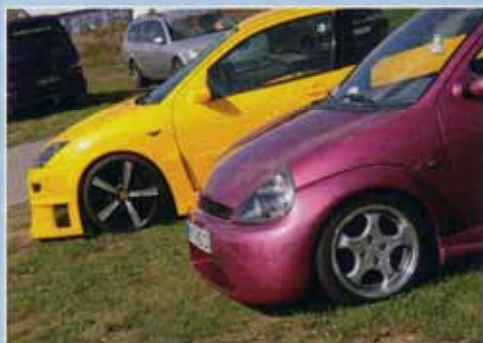
Die Spoiler-Jungs – Ka und Focus im neuen Gewand