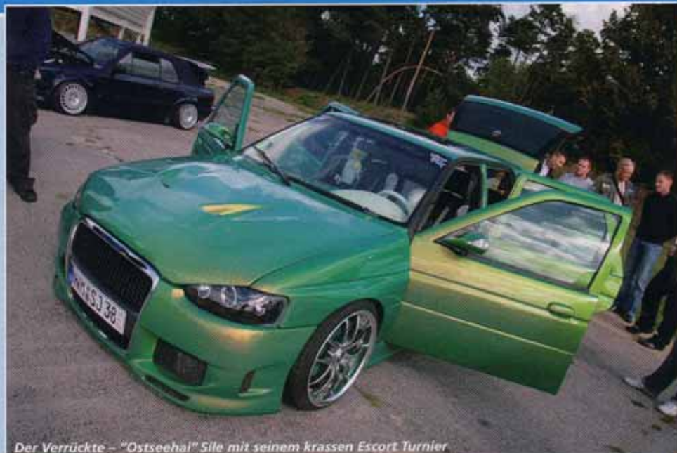
Der Verrückte – "Ostseehal" Sile mit seinem krassen Escort Turnier