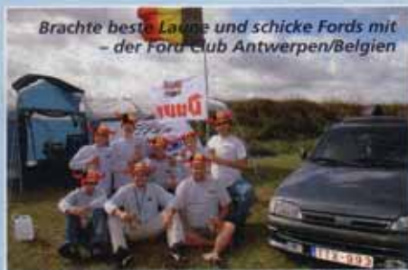
Brachte beste Laune und schicke Fords mit – der Ford Club Antwerpen/Belgien