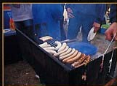
Auch in diesem Jahr darf wieder gegrillt werden