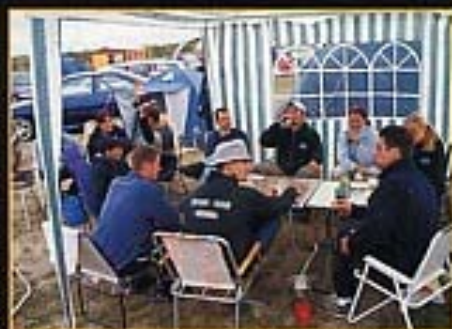
Das Escort-Team Grimma ist aus der Fordszene nicht wegzudenken

Die gesamte Ford-Palette traf sich zum Abschluss der 2002er Saison