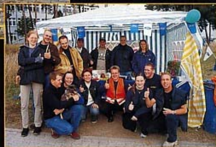
Der Ford-Club Berlin freut sich auf das nächste Abzelen