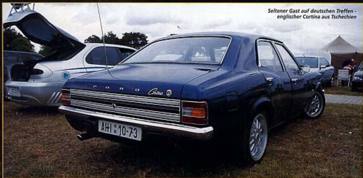
Seltener Gast auf deutschen Treffen - englischer Cortina aus Tschechien

"Stechen" - Mann gegen Mann, Auto gegen Auto. Das stieß letztendlich auch auf mehr Begeisterung bei den Ford-Fans. Parallel dazu verliefen die Clubwettspiele, angefangen vom Weitwurf eines mit Bauschaum ausgefüllten Airbaglenkrades über einen selbstgebauten "heißen Draht", eine DM-Geldbündelschätzung (die zusammengepressten Scheine hatten einen Wert von 75.000