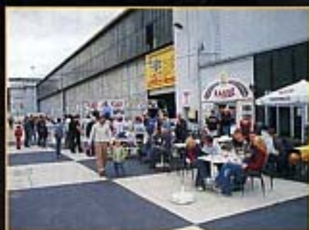
Bei "Sir Henry" gab es leckeres Essen für kleines Geld