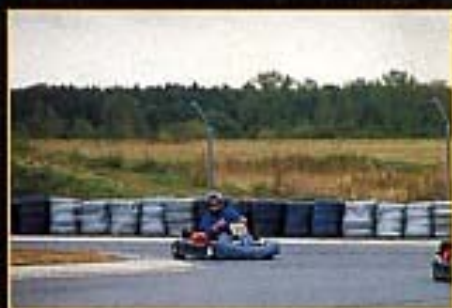
Gute Idee - Ford-Treffen an der Kartbahn