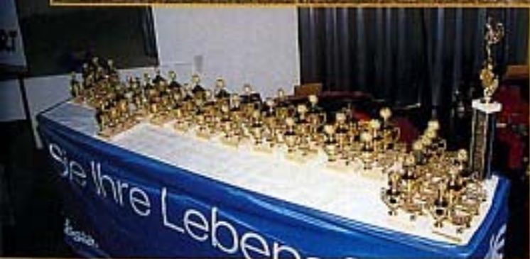
... wurden vergeben, darunter vier Sonderpokale